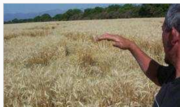
Misteriosos círculos en trigales salteños: ¿OVNIS o un fenómeno natural? | Ampliar imagen

Mientras cientos de curiosos llegan a graficar en sus cámaras digitales las nuevas apariciones de "Las Huellas de Chicoana", en Salta, salen a la luz numerosos testimonios de avistamientos producidos antes de ser hallados los agroglifos (círculos y dibujos gigantes en sembradíos) en los trigales de Las Mesitas, en el acceso del pueblo por la ruta provincial 32.