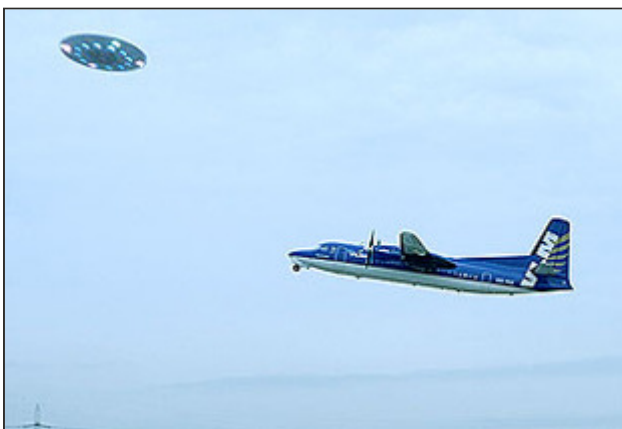
En 1991, un avión británico estuvo a punto de chocar contra un supuesto Ovni en Londres. El Gobierno parece querer cerrar no obstante el debate.

Todo parece indicar que el Gobierno del Reino Unido quiere zanjar definitivamente el debate sobre los Ovnis, u objetos voladores no identificados. Aunque el Ministerio lleva desclasificando archivos sobre estos fenómenos desde 2008, un nuevo e interesante documento ha revelado el modo estructurado y planificado en el que el Ejecutivo habría querido que estas informaciones salieran a la luz: nada de datos sobre seguridad aérea, tecnología defensiva o posibles contingencias con países extranjeros. ¿Tienen derecho los ciudadanos británicos a conocerlo todo o hay datos que es mejor que duerman para siempre?