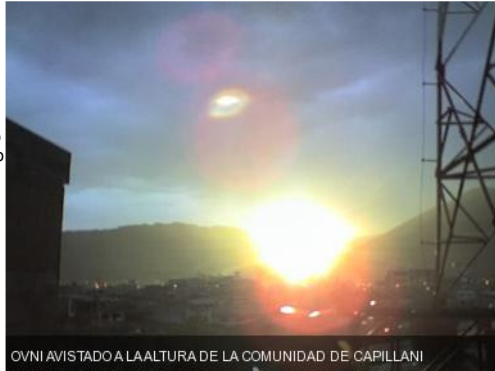
OVNI AVISTADO A LA ALTURA DE LA COMUNIDAD DE CAPILLANI

Los avistamientos de fenómenos aéreos inusuales se remontan a la antigüedad, pero el término OVNI se popularizó en 1947, cuando un piloto norteamericano observó mientras volaba una formación de varios objetos con forma de plato, con lo que los OVNI pasaron a conocerse popularmente como platillos voladores. Desde entonces, decenas de miles de personas en todo el mundo han asegurado haber visto ovnis.