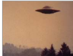
Un Ovni habría dejado sin luz a un pueblo salteño.

Utilidades fuente restaura enviar imprimir