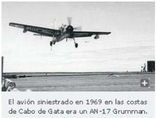
El avión siniestrado en 1969 en las costas de Cabo de Gata era un AN-17 Grumman.