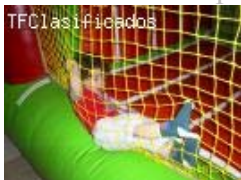
alquilo castillos inflables