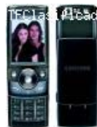
Vendo o Permuto