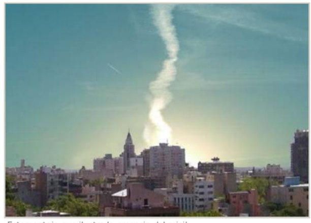
Fotomontaje que ilustra la creencia del misil.