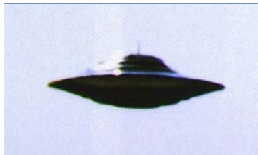
El eterno debate sobre la existencia o no de los extraterrestres

Estas, entre otras vivencias, podrán ser conocidas por todos, darles la dimensión que se merecen eso ya, depende de cada uno.