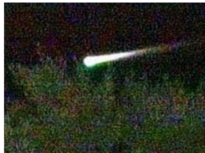
Luces como ésta fueron fotografiadas y filmadas en videos por residentes de

Según el Empire Tribune fueron identificados el año pasado